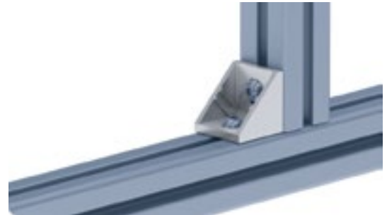
Winkel 30 Connection Angle 30